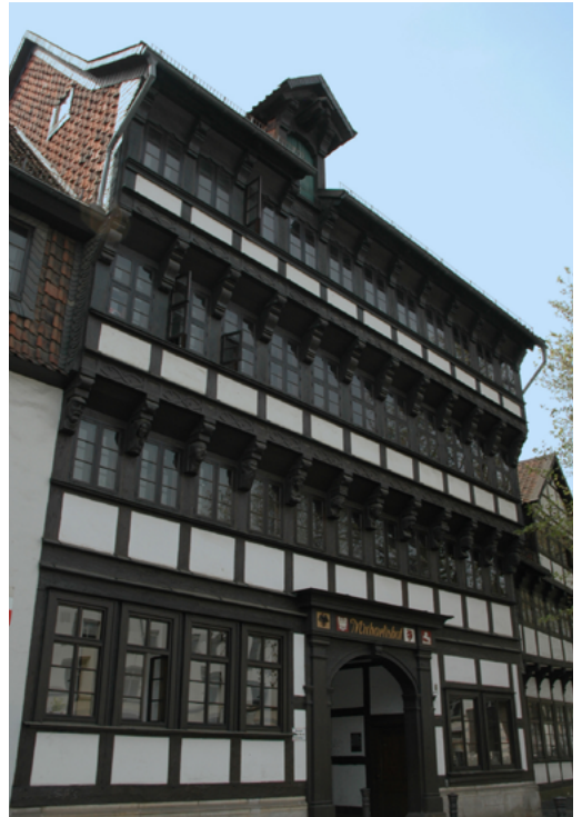
Studierendenwohnheime in Braunschweig: Karlstraße (links) und Michaelishof (rechts).