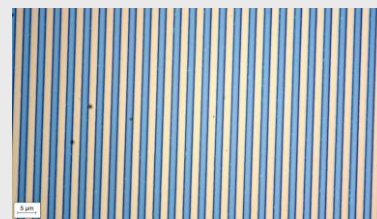
Fig. 2 (above): Prestructured Si-Wafer.