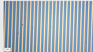
Abb. 2 (oben): Vorstrukturierter Si-Wafer.